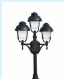
Mastleuchte für Glühlampen E27 - max.75 Watt

Mastleuchte ARL 503 - 3-flammig aus Aluminium-Druckguss mit klarem Blasenglas für die Montage auf einem Fundament. Als Leuchtmittel dienen 3 Glühlampen E27 a` max.75W. Alle Leuchtenteile sind korrosionsbeständig. Sie erhalten diese Leuchte wahlweise in Ausführung schwarz, braun/messing oder weiss.