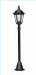
Mastleuchte für Glühlampe E27 - max.75 Watt

Mastleuchte ARL 302 - 1-flammig - aus Aluminium-Druckguss mit Montageplatte. Die Scheiben bestehen aus klarem Kathedralglas. Als Leuchtmittel dient 1 Glühlampe E27 a` 75W. Alle Leuchtenteile sind korrosionsbeständig. Sie erhalten diese Leuchte wahlweise in Ausführung schwarz/silber, braun/messing oder weiss/gold.