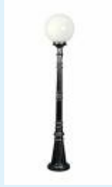
Mastleuchte für Glühlampe E27 - max.75 Watt

Mastleuchte ARL 101 - 1-flammig mit Aufsatz - aus Aluminium-Druckguss mit Montageplatt. Die Glaskugel ist opal. Als Leuchtmittel dient 1 Glühlampe E27 max.75W. Alle Leuchtenteile sind korrosionsbeständig. Sie erhalten diese Leuchte wahlweise in Ausführung schwarz/silber oder weiss/gold.