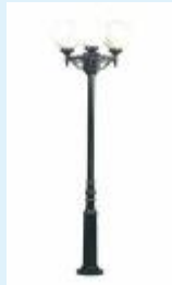
Mastleuchte für Glühlampen E27 - max.je 75 Watt

Mastleuchte ARL 102 - 3-flammig - aus Aluminium-Druckguss für die Montage auf einem Fundament. Die Glaskugeln sind opal. Als Leuchtmittel dienen 3 Glühlampen E27 a` 75W. Alle Leuchtenteile sind korrosionsbeständig. Sie erhalten diese Leuchte wahlweise in Ausführung schwarz/silber oder weiss/gold.