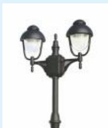
Mastleuchte für Glühlampen E27 - max.75 Watt

Mastleuchte ARL 502 - 2-flammig aus Aluminium-Druckguss mit klarem Blasenglas für die Montage auf einem Fundament. Als Leuchtmittel dienen 2 Glühlampen E27 a` max.75W. Alle Leuchtenteile sind korrosionsbeständig. Sie erhalten diese Leuchte wahlweise in Ausführung schwarz, braun/messing oder weiss.