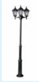
Mastleuchte für Glühlampen E27 - max.75 Watt

Mastleuchte ARL 301 - 3-flammig - aus Aluminium-Druckguss für die Montage auf einem Fundament. Die Scheiben bestehen aus klarem Kathedralglas. Als Leuchtmittel dienen 3 Glühlampen E27 a` 75W. Alle Leuchtenteile sind korrosionsbeständig. Sie erhalten diese Leuchte wahlweise in Ausführung schwarz/silber, braun/messing oder weiss/gold.